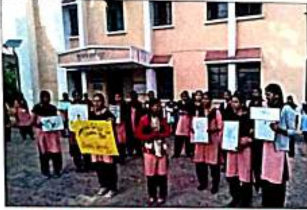
स्वकुकुतरु अभरुतुत अंतुगंत स्वकुकुतरु संदुश देतरुनरु वरुधरुी