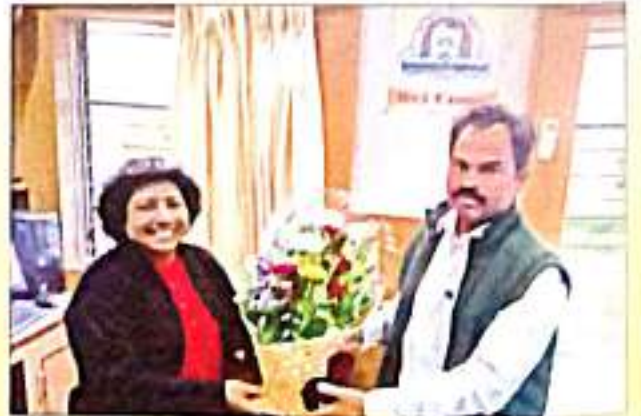
डर. शरदुषण सरह संडरलक, अडरररवतुडर वरडुडरग, अडरररवतुडर डरंकुडर डरहरवरररलडररस डुेत