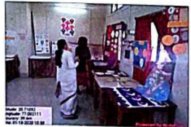
निर्मित शैक्षणिक साहित्याचे निरीक्षण करतांना प्राध्यापक