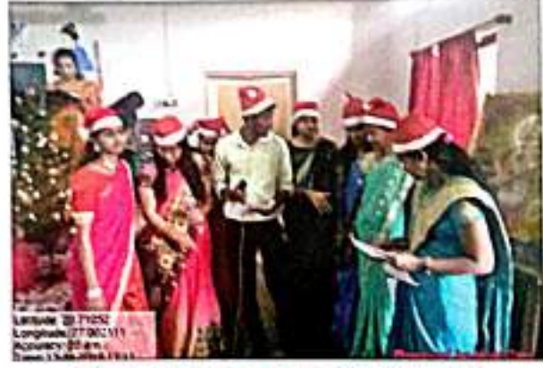
ख्रिस्तमस नाताळ साजरा करतांना प्रशिक्षणार्थी