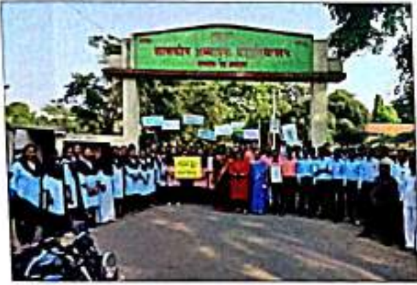
स्वच्छता अभियानात सहभागी विद्यार्थी व प्राध्यापक