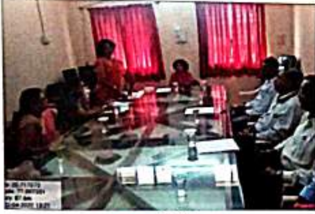
IQAC समिती सभा