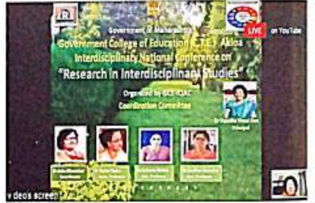
ररुषुडर चरुकरसुतुर - २०२० सडनुडर सदसुडर