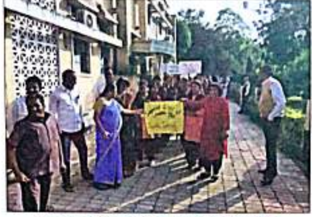
स्वकुकुतरु अभरुतुत रंलीत सहडरुगी डुरशरकुषणरुधरुी, डुररकरुधरुी, डुररधुतुडक वुंद व कडुडरुकी वडुग