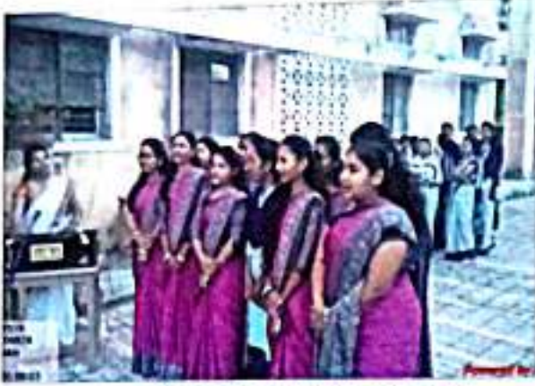
प्रजासत्ताक दिनानिमित्त देशभक्तीपर गीत सादर करताना बी.एड. प्रशिक्षणार्थी