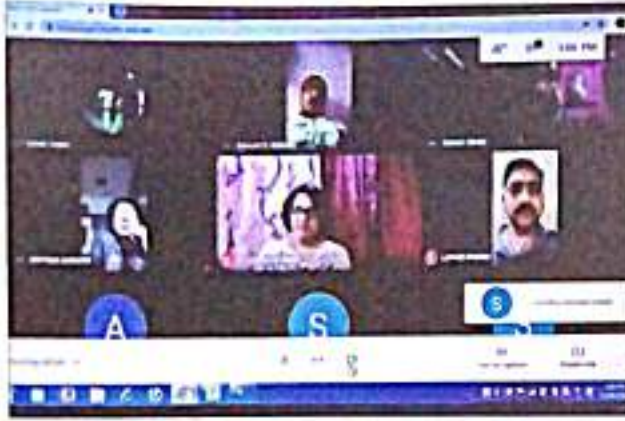
तरण तरणरवरके वुवरवसुथरषन ऑनलरईन वेवरनरर डुरेरणरसुथरन : डर. डुररकररु डॉ. वसुधर देव सडनुवुड डॉ. आशर डररसुकर