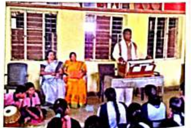
सामाजिक उपक्रमांतर्गत अंध विद्यालयातील विद्यार्थी गीत सादर करताना