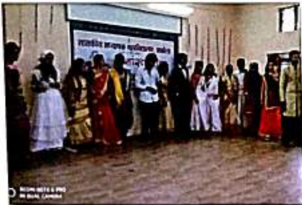
सांस्कृतिक कार्यक्रमात सहभागी विद्यार्थी