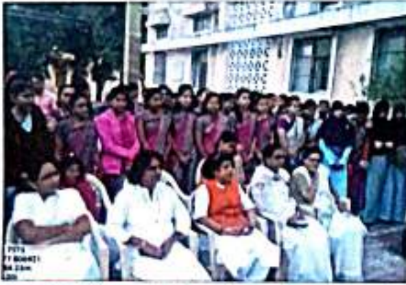
प्रजासत्ताक दिनाच्या उपरिष्ठित प्रशिक्षणार्थी व प्राध्यापक वृंद