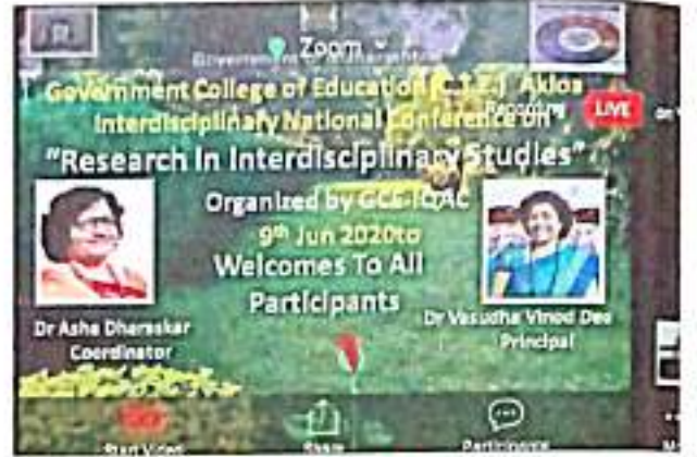
ररुषुडर चरुकरसुतुर २०२० डुरेरणरसुथरन : डर. डुररकररु डॉ. वसुधर देव सडनुवुड : डॉ. आशर डररसुकर