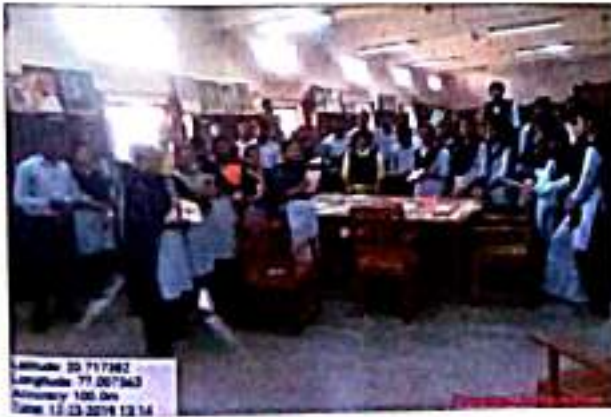
बाचनालयात प्रशिक्षणाध्यासोबत हितगुज करतांना प्राध्याप्या