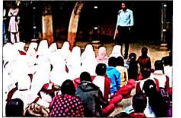
सावित्रीबाई फुले जि.प. कन्या शाळा अंतर्गत छात्र सेवाकाळ प्रसंगी बी.एड. प्रशिक्षणार्थी शालेय विद्यार्थ्यांना मार्गदर्शन करतांना