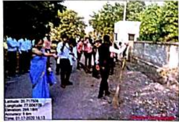
स्वच्छता अभियान राबवितांना प्राध्यापक व प्रशिक्षणार्थी