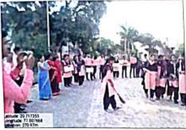
स्वच्छता अभियानात सहभागी विद्यार्थी