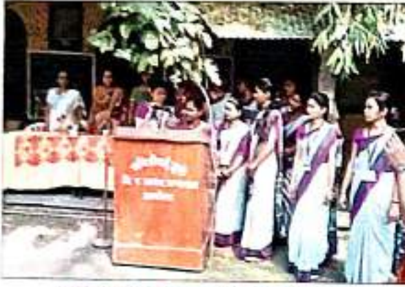
सावित्रीबाई फुले कन्या शाळेत छात्रसेवाकाळ अंतर्गत गीतनायन करतांना विद्यार्थी