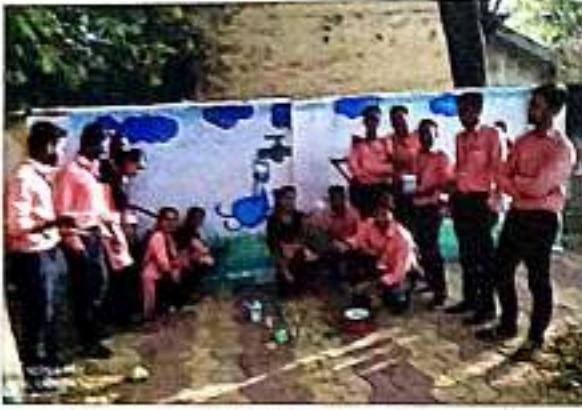
SUPW कार्यशाळेत प्रशिक्षणार्थी वॉलपेंटिंग करतांना