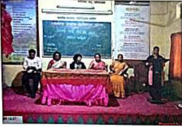
आचार्य पदवी (पीएच.डी.) कोर्स वर्क २०२० उद्घाटन कार्यक्रम