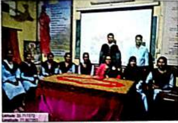
वाचन-परायर्तित विषय वस्तु कार्यशाळा