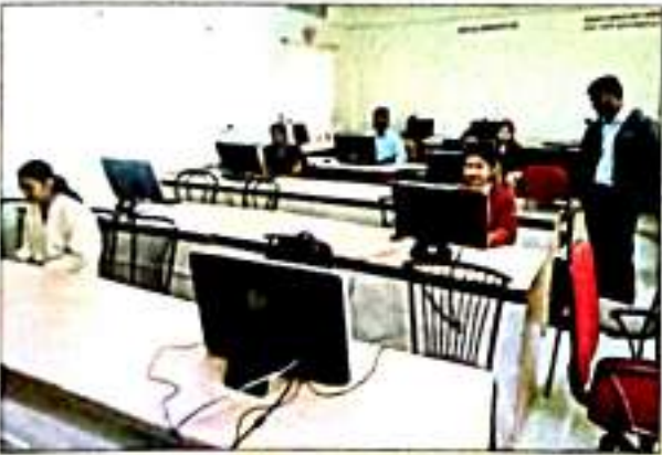
आय. सी. टी. प्रात्यक्षिक करतांना बी.एड. प्रशिक्षणार्थी