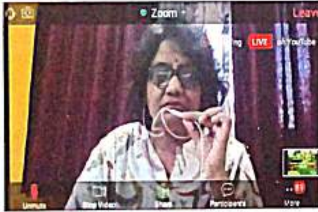
ऑनलरईन ररुषुडर चरुकरसुतुर २०२० सडनुवुड डॉ. आशर डररसुकर डुररसुतरवुड कररतरनर