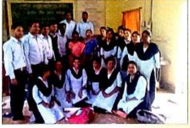
शैक्षणिक साहित्य निर्मिती कार्यशाळेप्रसंगी मार्गदर्शक व प्रशिक्षणार्थी