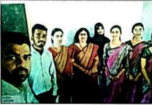
ज्युविली इंग्लिश हायस्कूल अंतर्गत छात्र सेवाकाळ प्रसंगी बी.एड. प्रशिक्षणार्थी व शाळेतील मुख्याध्यापक व शिक्षक