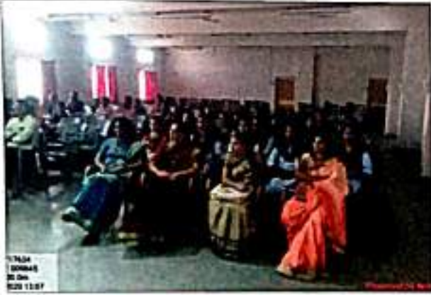
माजी विद्यार्थी मेळाव्यास उपस्थित माजी विद्यार्थी व प्राध्यापकवृंद