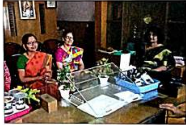
अंमित पाठ परीक्षा २०२० च्या आयोजन प्रसंगी उपस्थित बहिस्थ परीक्षक