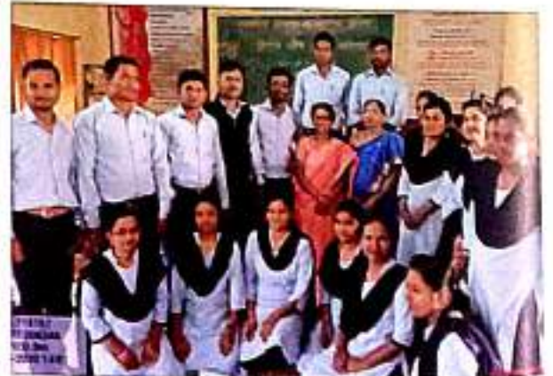
शैक्षणिक साहित्य निर्मिती कार्यशाळा