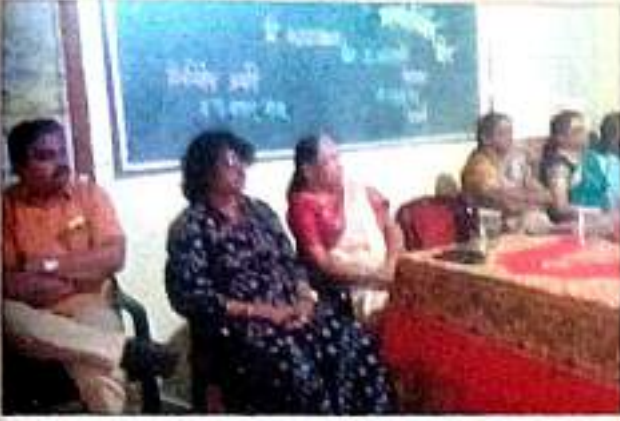
डॉ. बाबासाहेब आंबेडकर महापरिनिर्वाण दिनाभिगीत आयोजित कार्यक्रमप्रसंगी उपस्थित मान्यवर