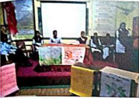
वाचन-परायर्तित विषय वस्तु कार्यशाळेचे आयोजन