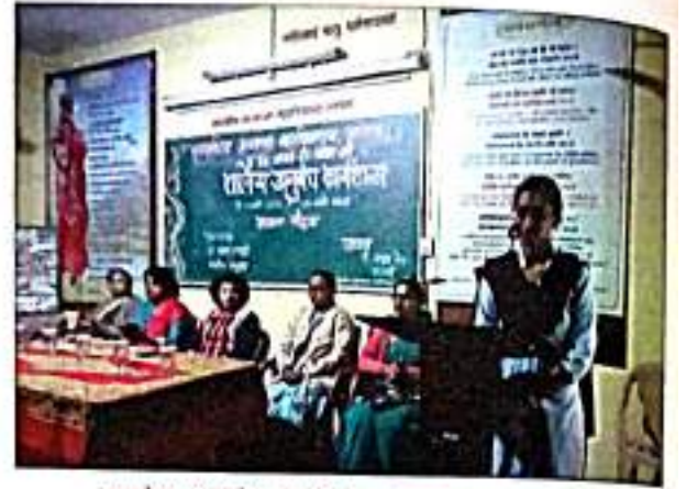
शालेर अनुबंध करररररररर उदुघाटरन सरररररर ररसंगी उरररररर रररररर