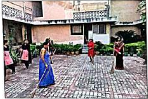
स्वच्छता अभियानात प्राध्यापकांचा सहभाग