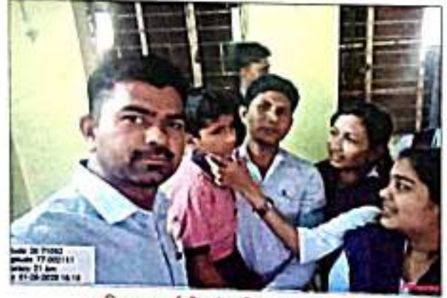
प्रशिक्षणाध्याची अंध विद्यालयाला भेट