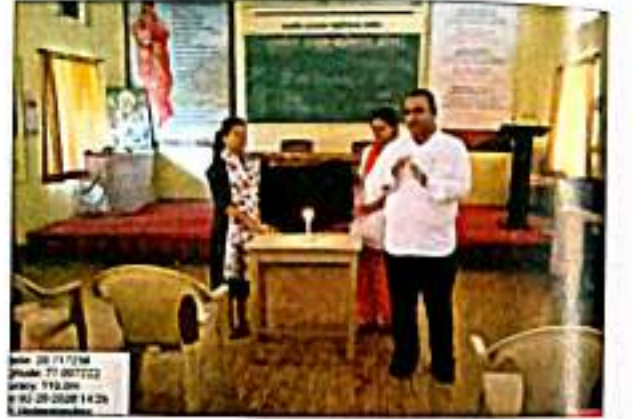
स्व:आकलन कार्यशाळेत मार्गदर्शन करताना