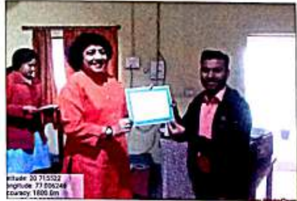
गंधी वरुधरुी डुररकुषुडील डुरशस्वी वरुधरुी डुरडरणडडुर सुवरुकरतरुनरु