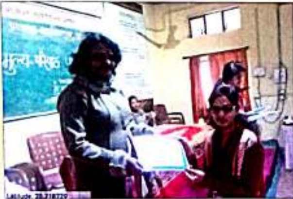
गंधी वरुधरुी डुररकुषुडील डुरशस्वी वरुधरुी डुरडरणडडुर सुवरुकरतरुनरु