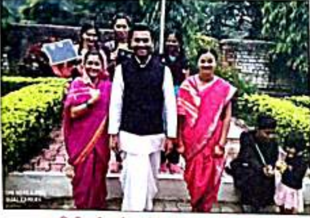
सरवरुषुरेडरई फुले कडंती नरुतुत एक नरुटीकड