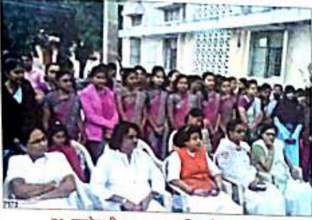
२६ जानेवारी प्रजासत्ताक दिनाचे आयोजन