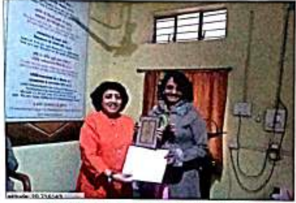
गंधी वरुधरुी संसुकर डुररकुषड २०१९ कुडरु डुरशस्वी आडुडुनरुवरुडत सडनुडडक डुी. आशरु डुररसुकुर डुररकड सतुकर