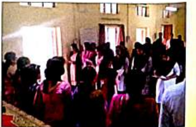
संविधान दिनानिमित्त प्रतिज्ञा घेतांना बी.एड. प्रशिक्षणार्थी व प्राध्यापक वृंद