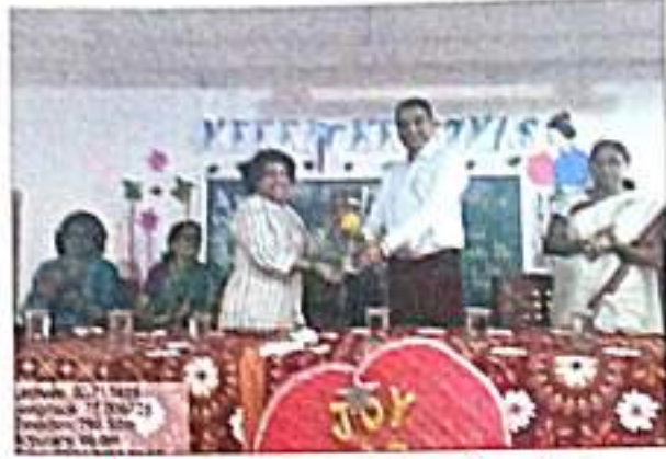
ख्रिस्तमस नाताळ निमीत कार्यक्रमाचे आयोजन