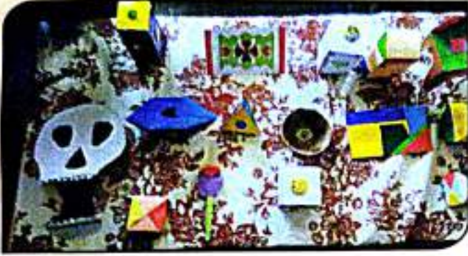
कार्यानुभव कार्यशाळेत छात्राध्यापकांनी तयार केलेले साहित्य