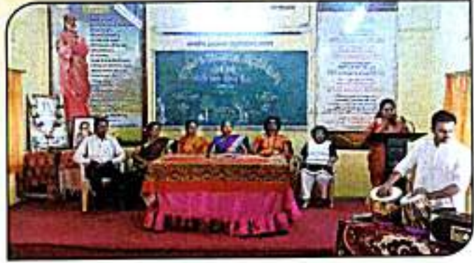
जागतिक मराठी राजभाषा दिनानिमित्त लाभले आम्हास भाग्य बोलतो मराठी या गीताचे गायन करताना छात्राध्यापक