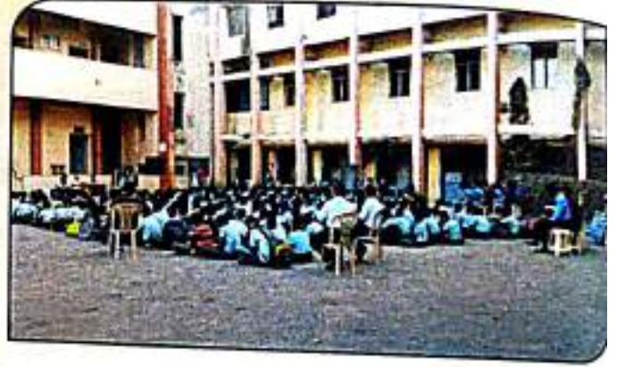
छात्रसेवाकाळ अंतर्गत न्यु इंग्लिश हायस्कूल मध्ये अभ्यासपुरक कार्यक्रम राबविताना छात्राध्यापक